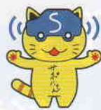
安全運転サポート車普及啓発協議会キャラクター「サボにゃん」