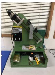
ピールリング測定器 めっき密着強度測定に使用