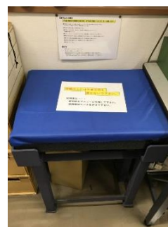
定盤 寸法測定や測定機器の校正に使用