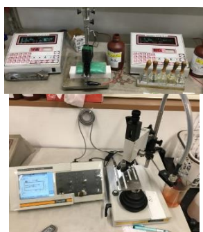
電解式膜厚計 めっき膜厚測定に使用

測定室では主に「めっき膜厚の測定」「めっきの密着(ピールリング)強度測定」「寸法測定」「測定器具の校正」を行っています。特にめっき膜厚の測定は製品の種類、頻度が多いため4台の測定器を1人で使いこなしています。素晴らしい技術です。